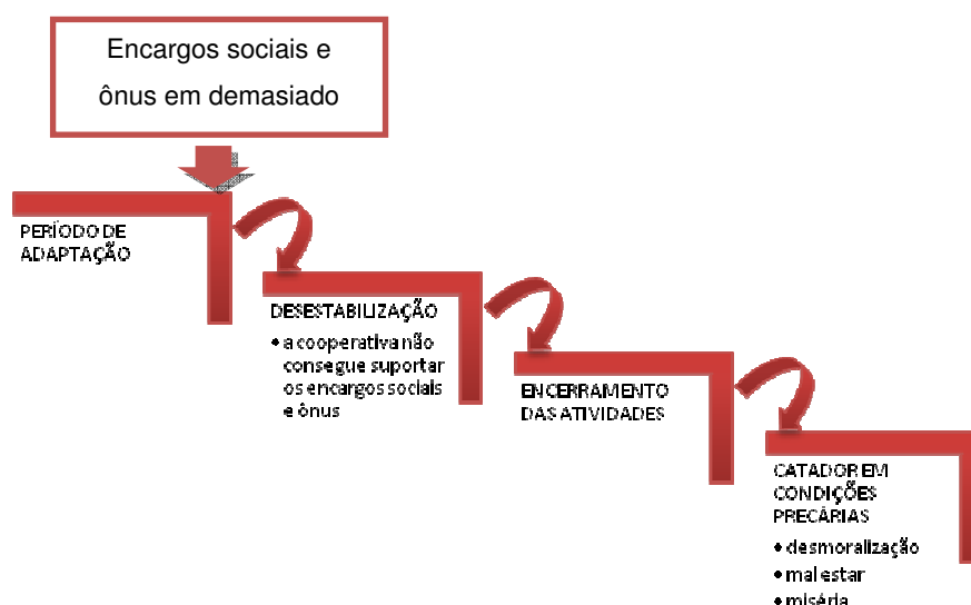
Figura 4 - Diagrama de declínio de uma cooperativa de catadores de materiais recicláveis

Por outro lado, se as cooperativas encontrarem entraves durante o período de adaptação como, por exemplo, não suportarem os encargos sociais e os ônus em demasia, poderá ocorrer um processo de declínio e, conseqüentemente, a desestabilização do empreendimento com o possível encerramento das atividades e a volta dos catadores as condições precárias, tendo que buscar outras atividades. Deve se levar em consideração que o período de adaptação é variável conforme os aspectos individuais de cada cooperativa de catador. Na Figura 4 é mostrado um diagrama com o processo de declínio de cooperativas face aos problemas citados.